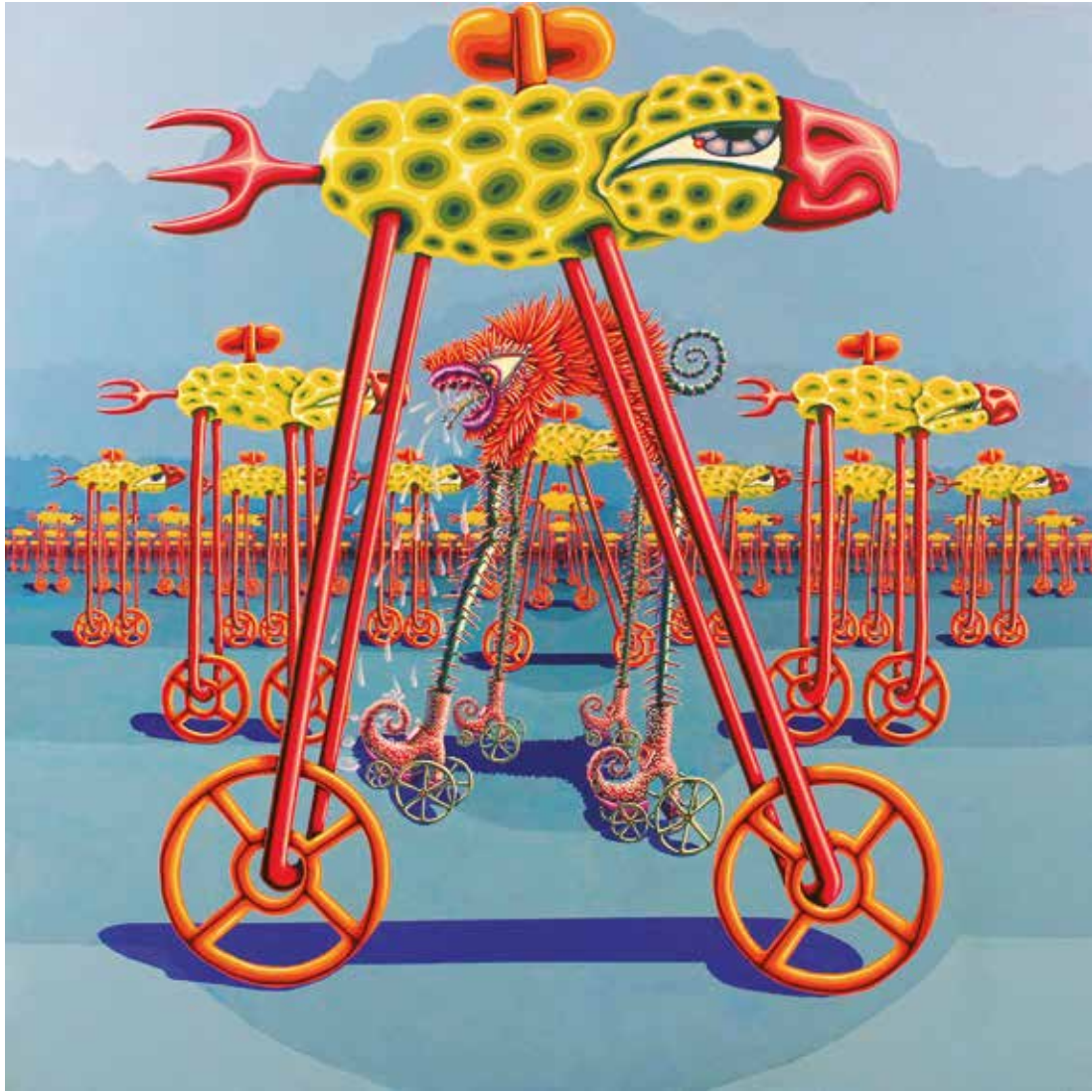
Vee mee Acrílico sobre tela - Año: 2004 Medidas: 200 x 200 cm