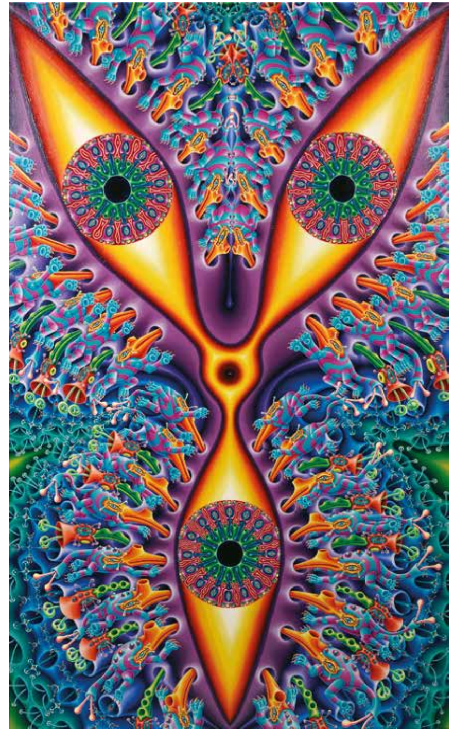
Contemplario Acrílico sobre tela - Año: 2014 Medidas: 200 x 120 cm