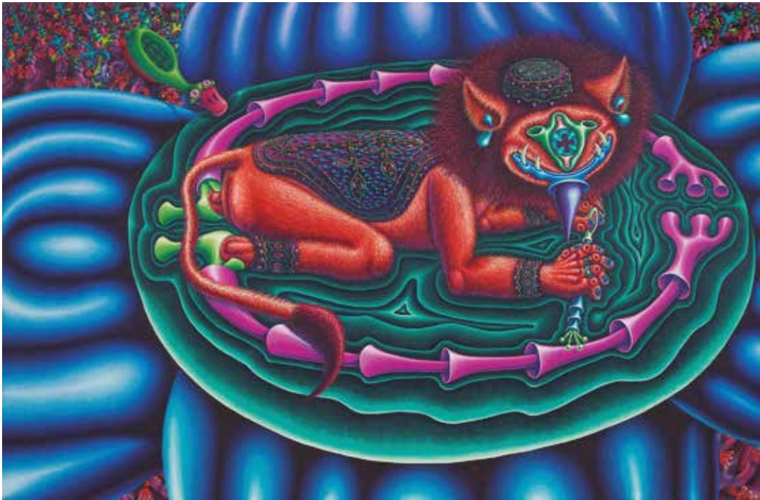
Reinvención del nimbo

Un universo originalísimo, colmado de monstruos y figuras imaginadas como si estuviéramos de nuevo frente al descubrimiento de un mundo. Un mundo que se escapa del miedo a lo desconocido gracias a la exposición que hace Rubín de él, de este despliegue espectacular del ritmo, de la repetición, de la desmesura en su obra que si rememora el pasado remoto habla también de un futuro fantástico y de ficción, pero no por ello menos verosímil.