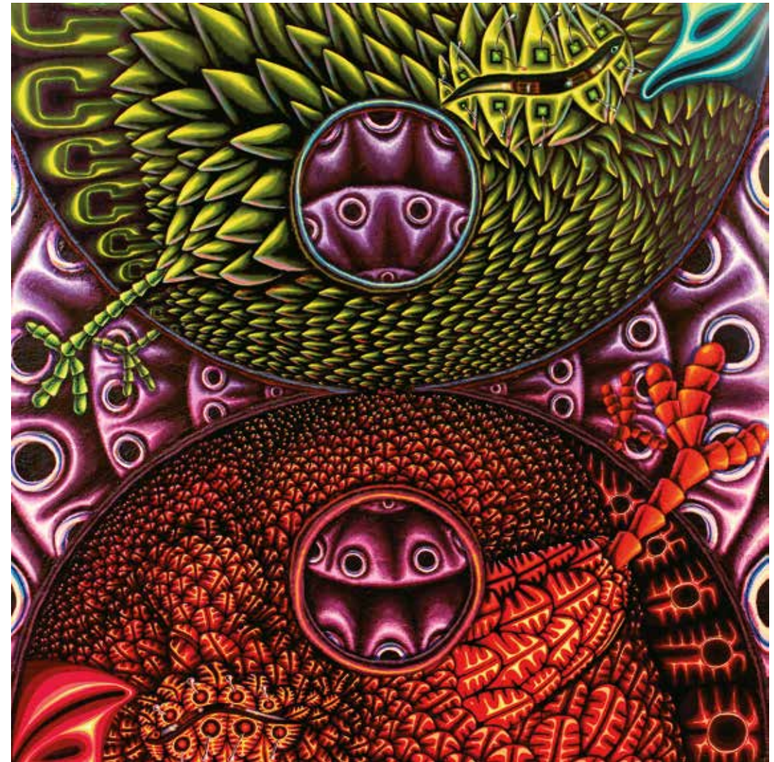
Amor gryère Acrílico sobre tela - Año: 2004 Medidas: 200 x 200 cm