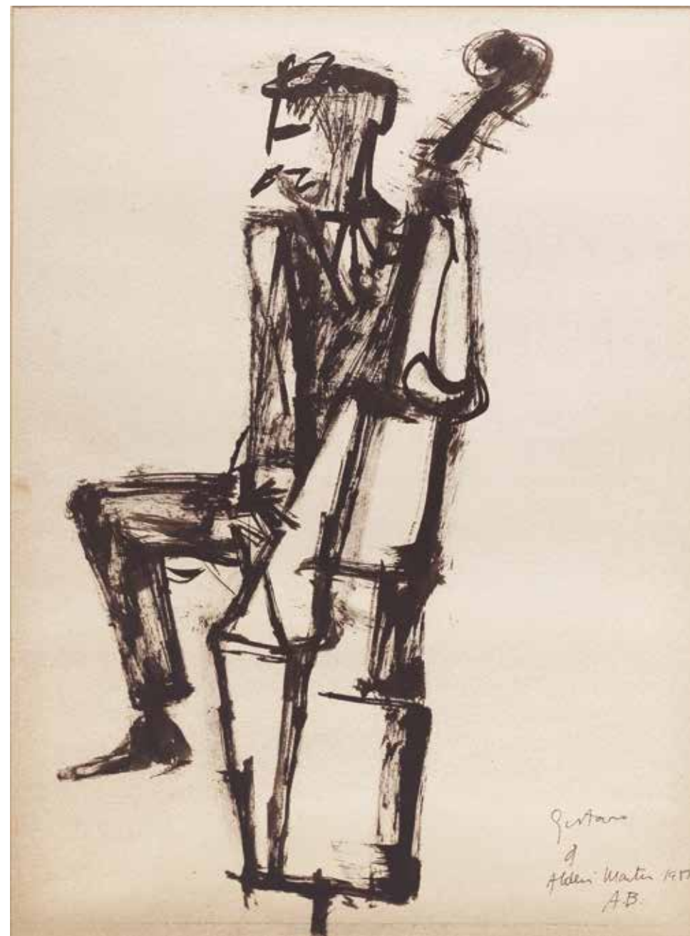
Gustavo Tinta sobre papel - Año: 1958 Medidas: 40 x 30 cm