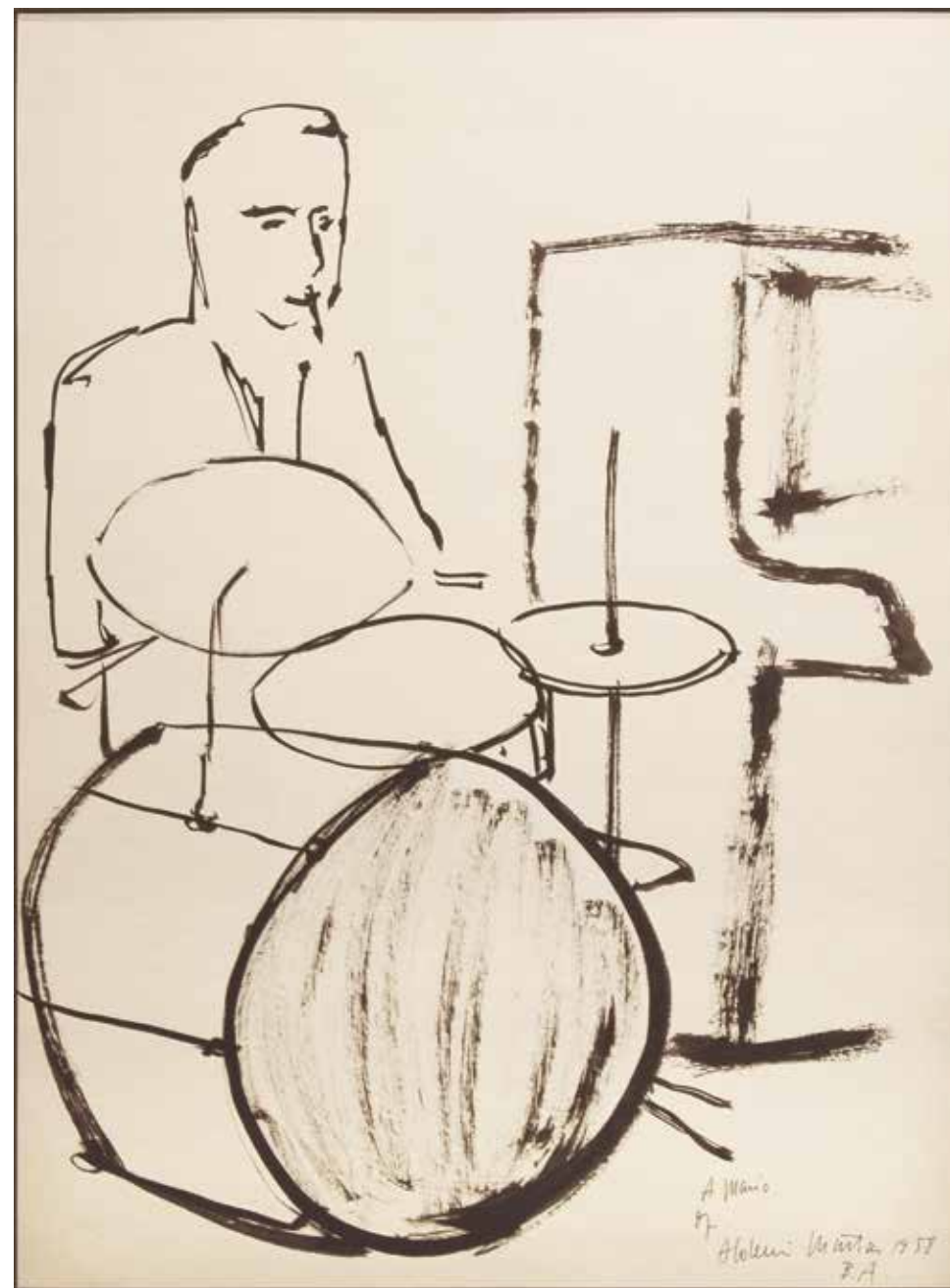
Mario Tinta sobre papel - Año: 1958 Medidas: 40 x 30 cm