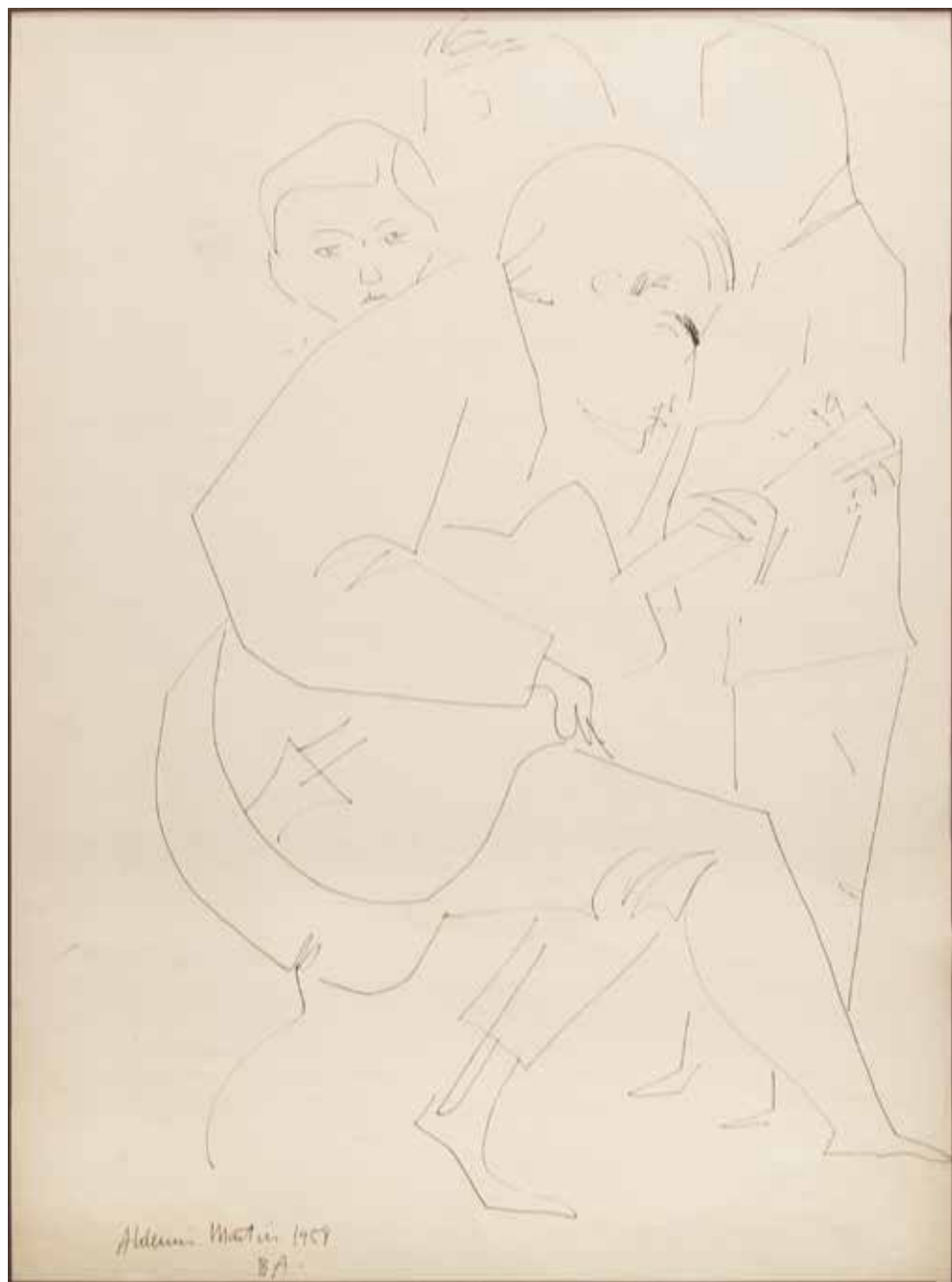
Sin título Tinta sobre papel - Año: 1958 Medidas: 40 x 30 cm