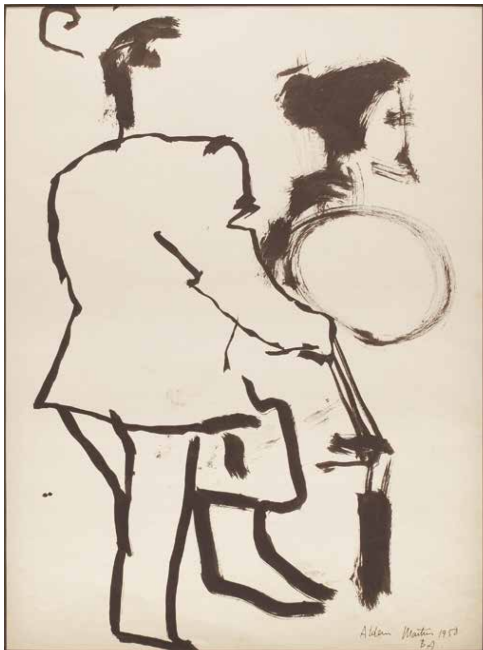
Sin título Tinta sobre papel - Año: 1958 Medidas: 40 x 30 cm