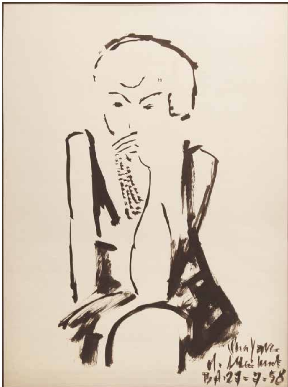
Sin título Tinta sobre papel - Año: 1958 Medidas: 40 x 30 cm