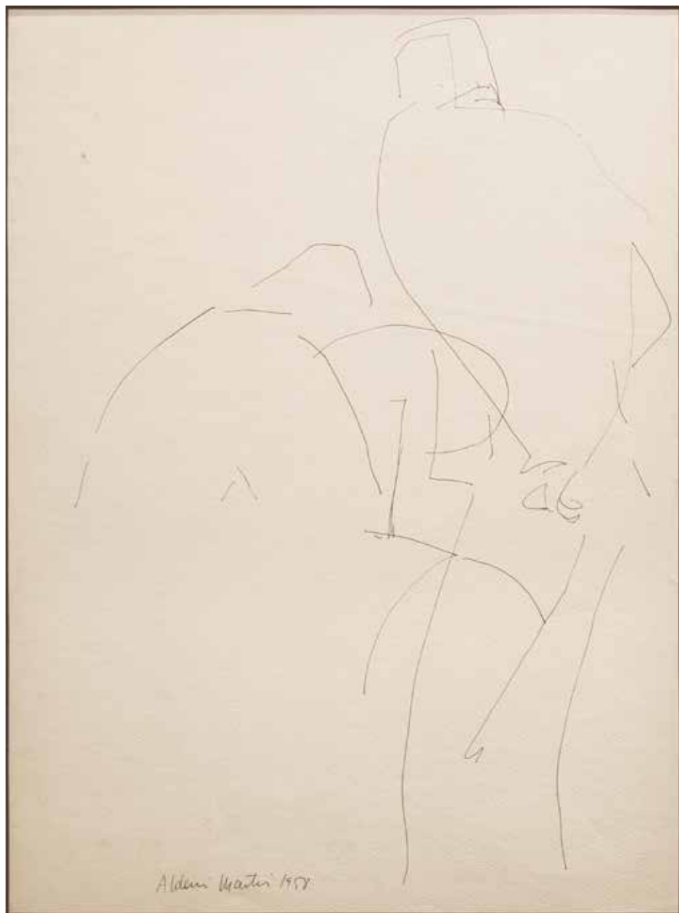
Sin título Tinta sobre papel - Año: 1958 Medidas: 40 x 30 cm