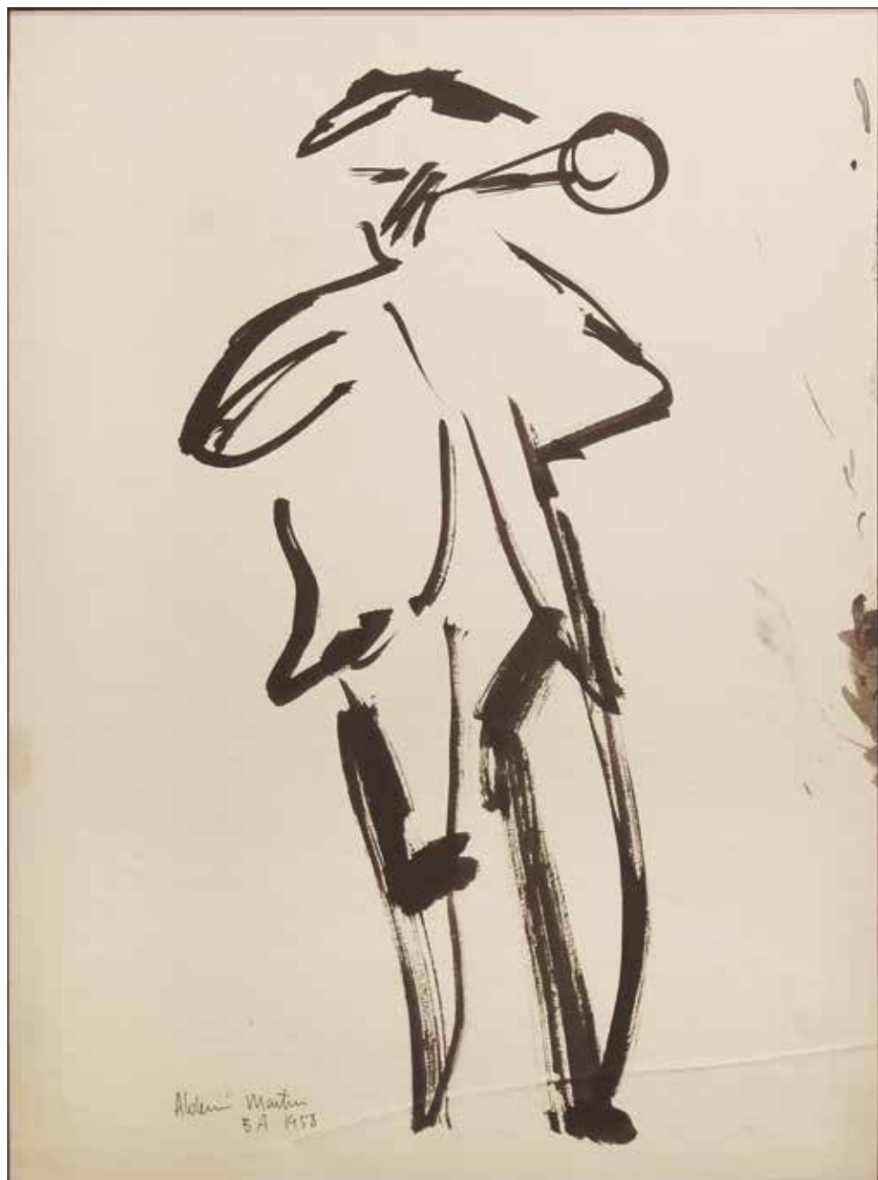
Sin título Tinta sobre papel - Año: 1958 Medidas: 40 x 30 cm