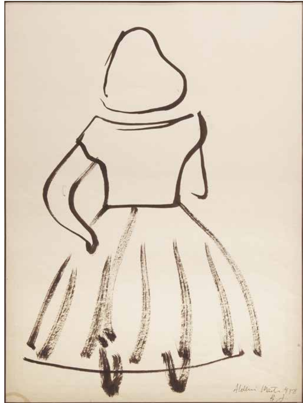
Sin título Tinta sobre papel - Año: 1958 Medidas: 40 x 30 cm