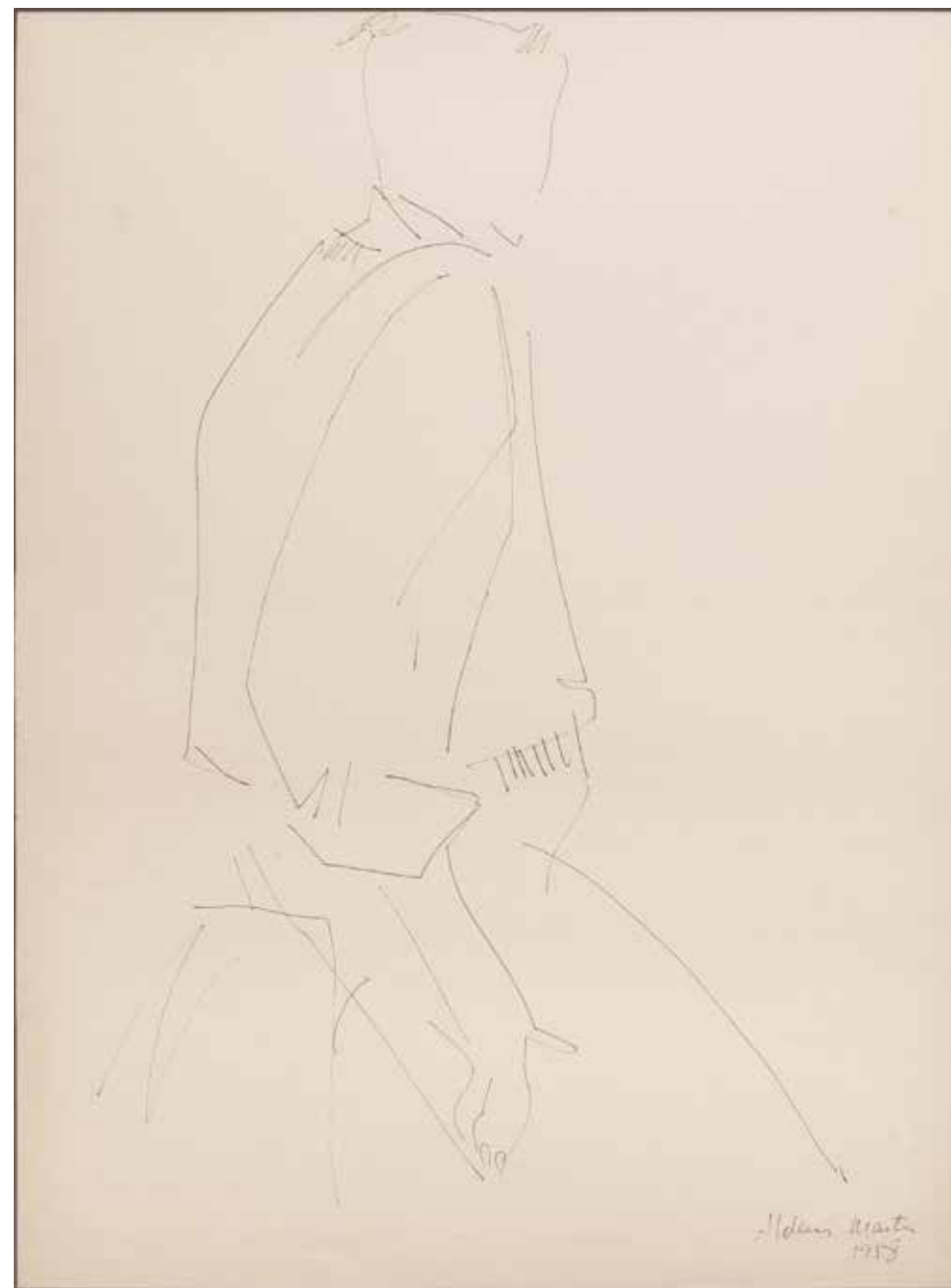
Sin título Tinta sobre papel - Año: 1958 Medidas: 40 x 30 cm