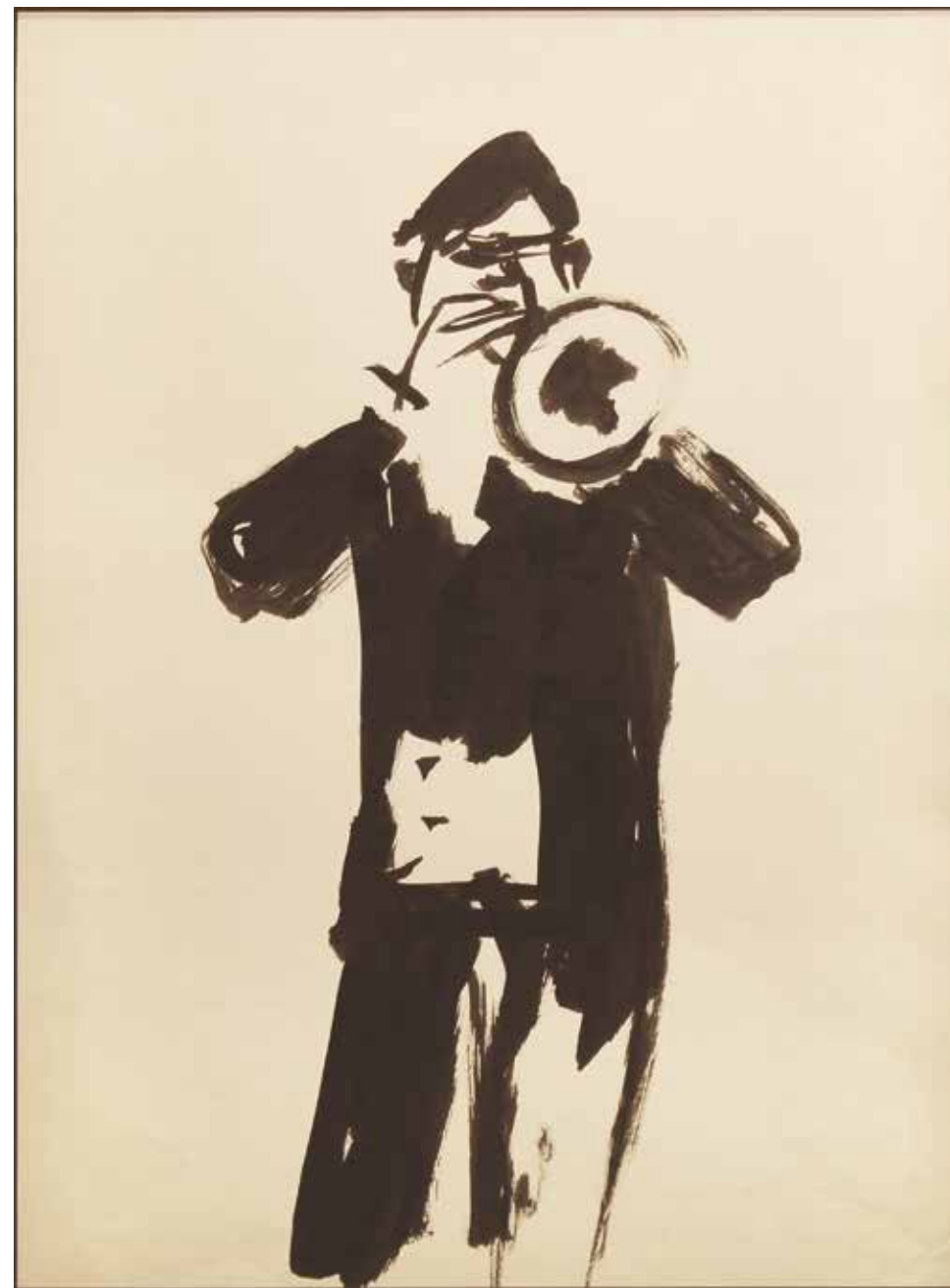
Sin título Tinta sobre papel - Año: 1958 Medidas: 40 x 30 cm