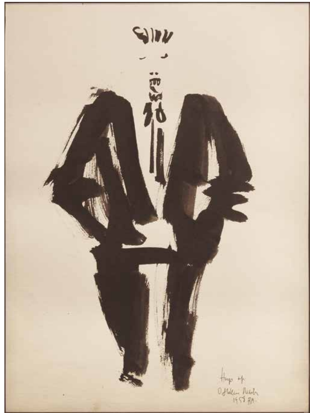
Hugo Pratt Tinta sobre papel - Año: 1958 Medidas: 40 x 30 cm