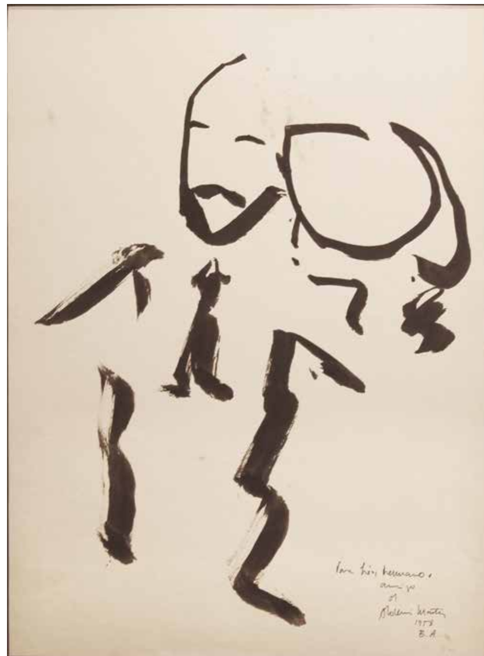
Para Leo Tinta sobre papel - Año: 1958 Medidas: 40 x 30 cm