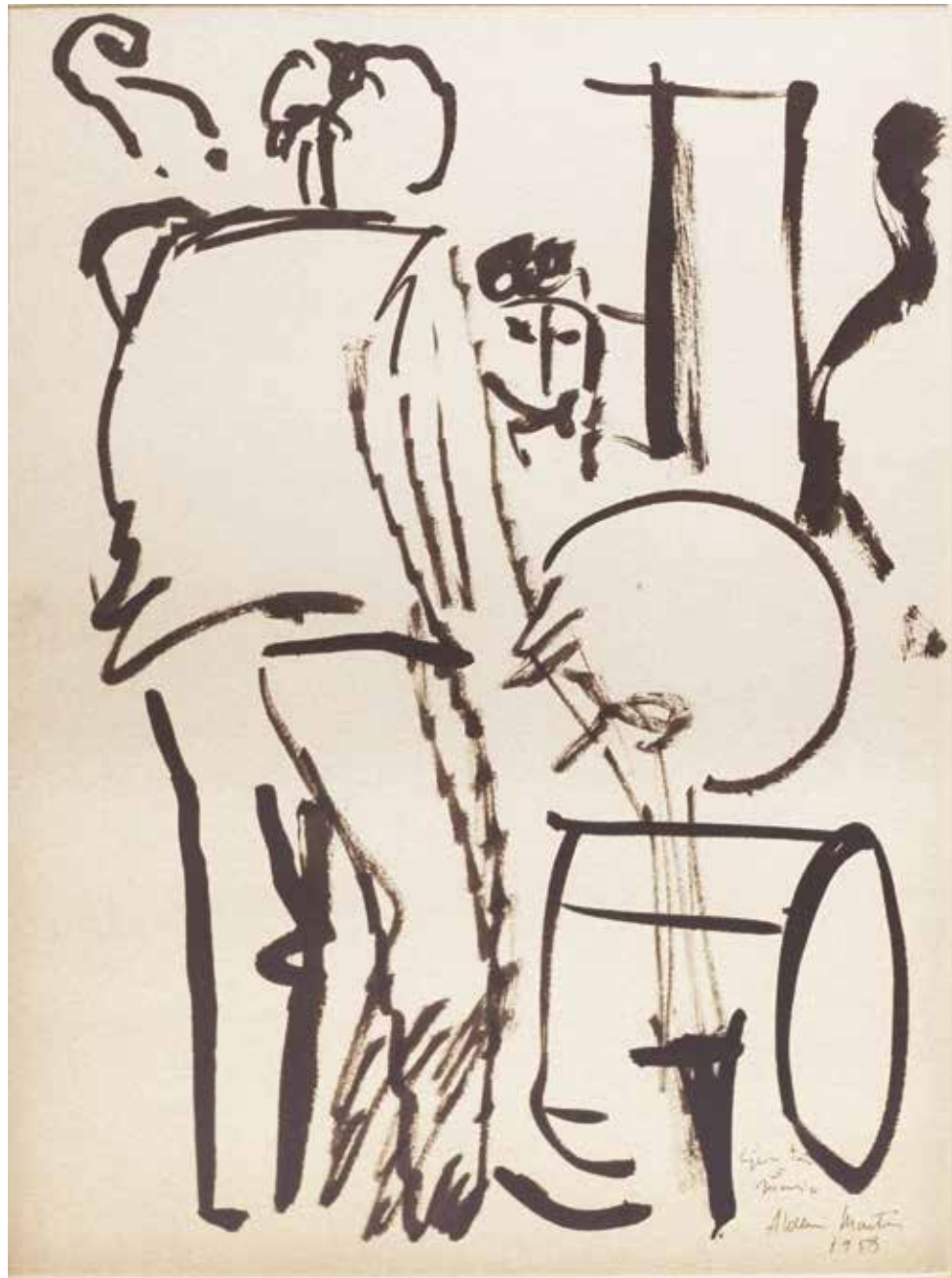
Gustavo y Mario Tinta sobre papel - Año: 1958 Medidas: 40 x 30 cm