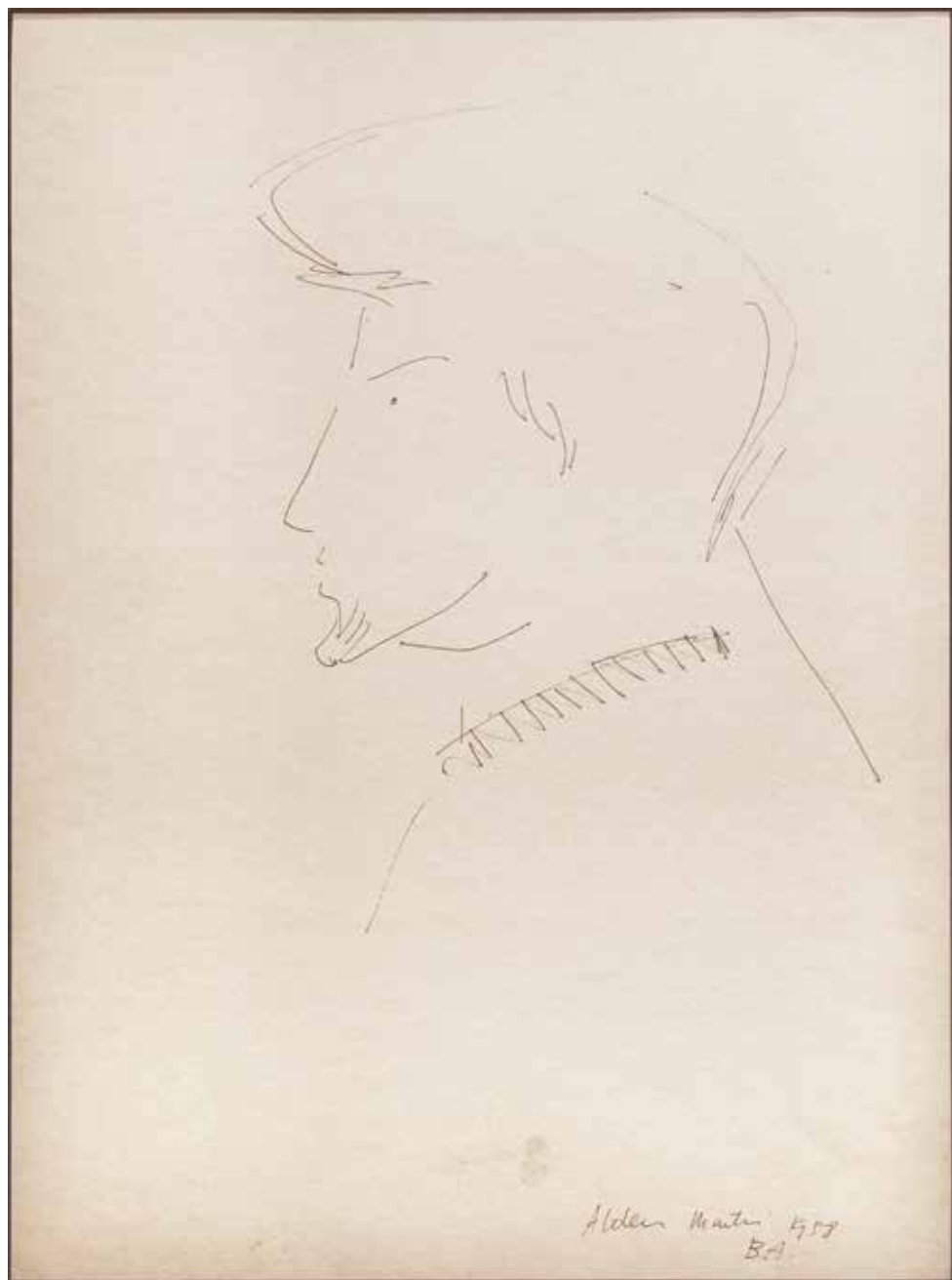
Sin título Tinta sobre papel - Año: 1958 Medidas: 40 x 30 cm