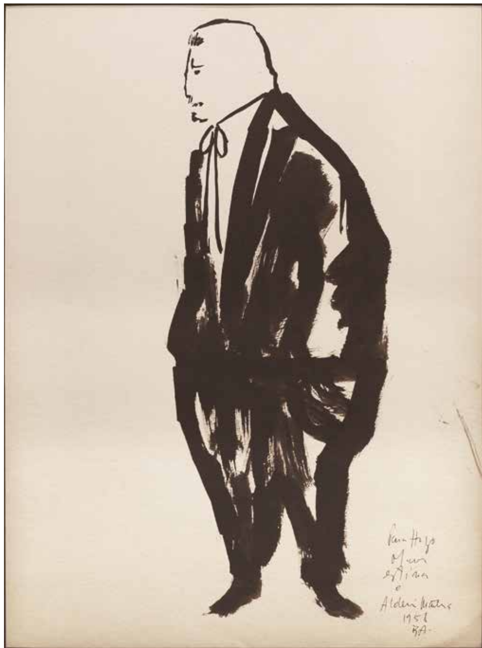
Hugo Tinta sobre papel - Año: 1958 Medidas: 40 x 30 cm