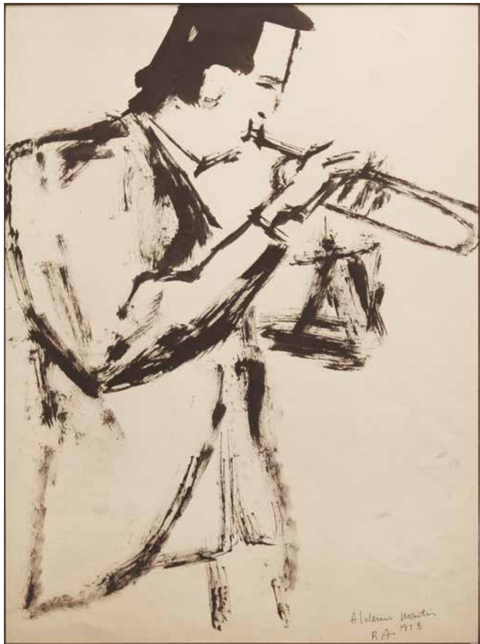
Sin título Tinta sobre papel - Año: 1958 Medidas: 40 x 30 cm