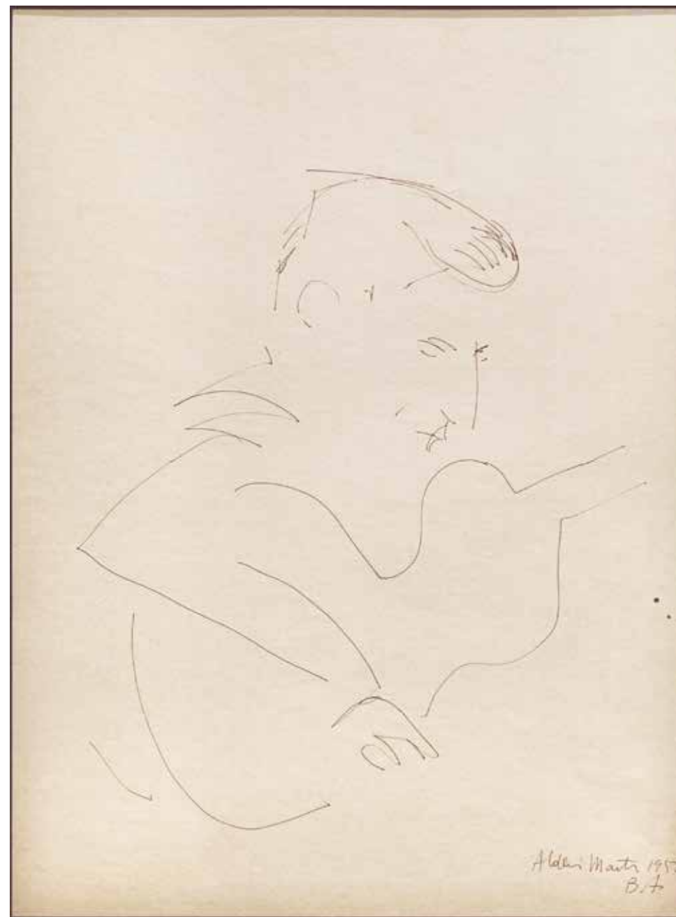
Sin título Tinta sobre papel - Año: 1958 Medidas: 40 x 30 cm