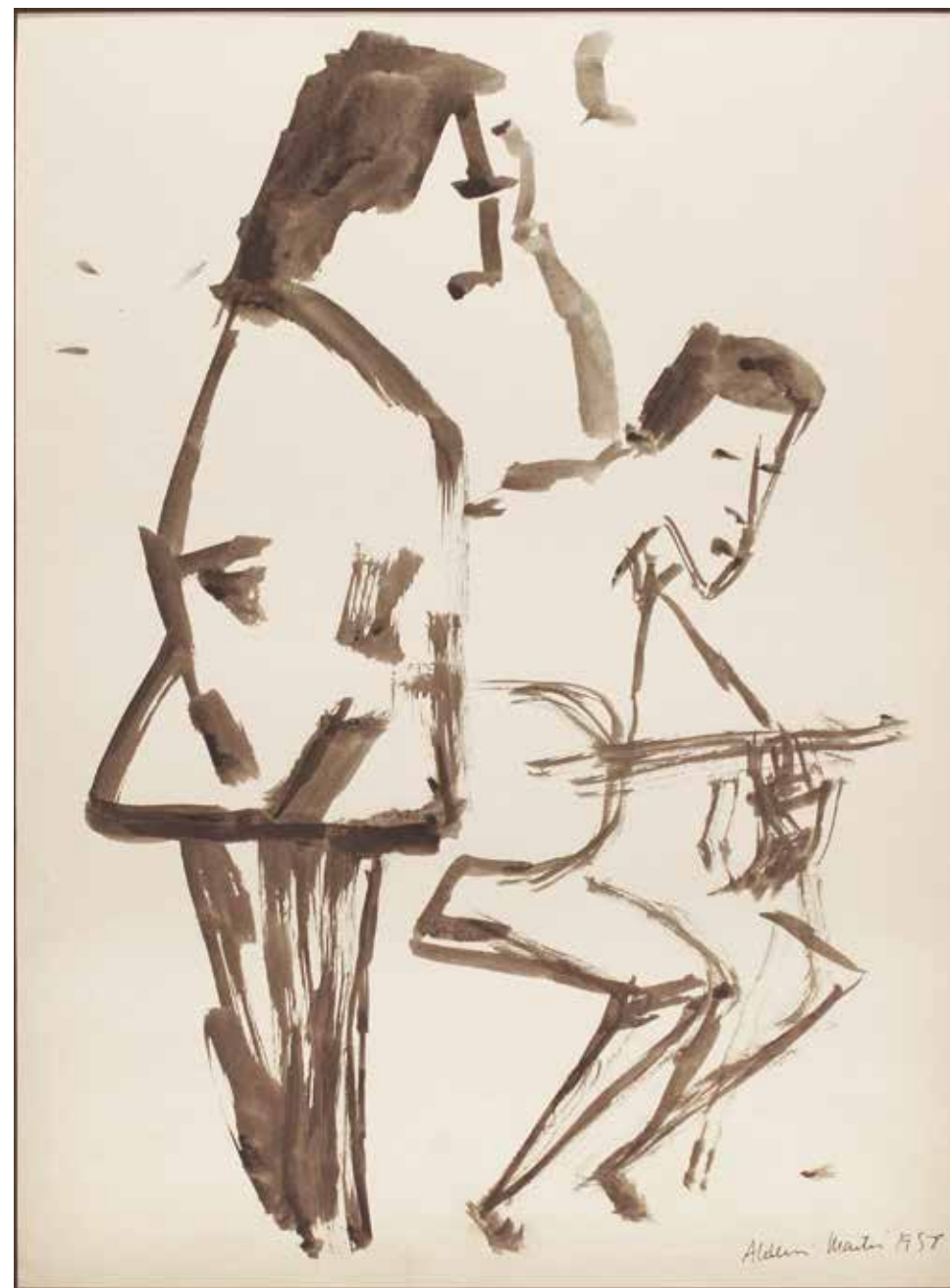
Sin título Tinta sobre papel - Año: 1958 Medidas: 40 x 30 cm